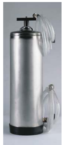
Se suministra completo con mangueras de entrada y salida de 3/4.